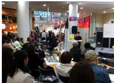
多世代で支えた26年度ボランティア祭り