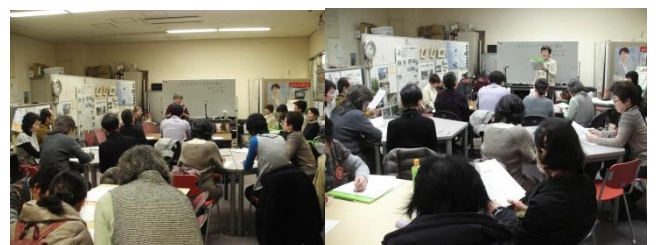
朗読ボランティア玉手箱講座