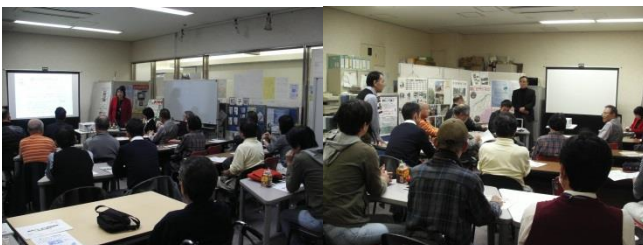
輝け！ハイブリッドシルバー講座