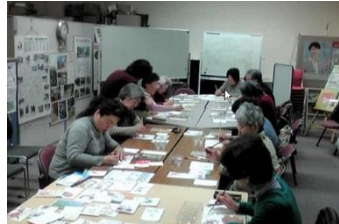
ミモザの会 絵手紙講座