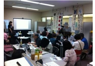
KDDI Jimdoチーム Jimdoカフェ