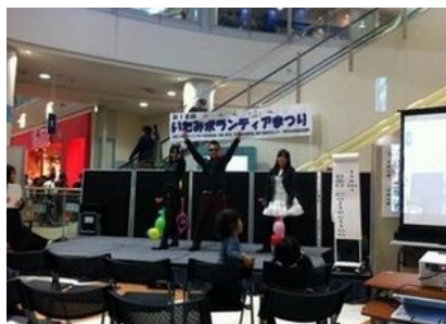
若者たちが企画実行した障がいをもたれた方のファッションショー