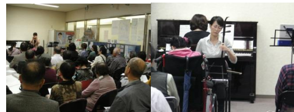
四つ葉のクローバー