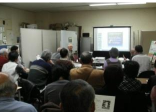
中国残留孤児支援つじの会