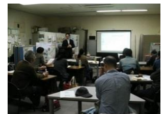
非営利活動と インターネットショップ講座