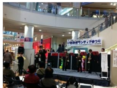
市職員で構成される伊丹フィル ハーモニー管弦楽団によるトロン ボーンクインテットも観客を魅了